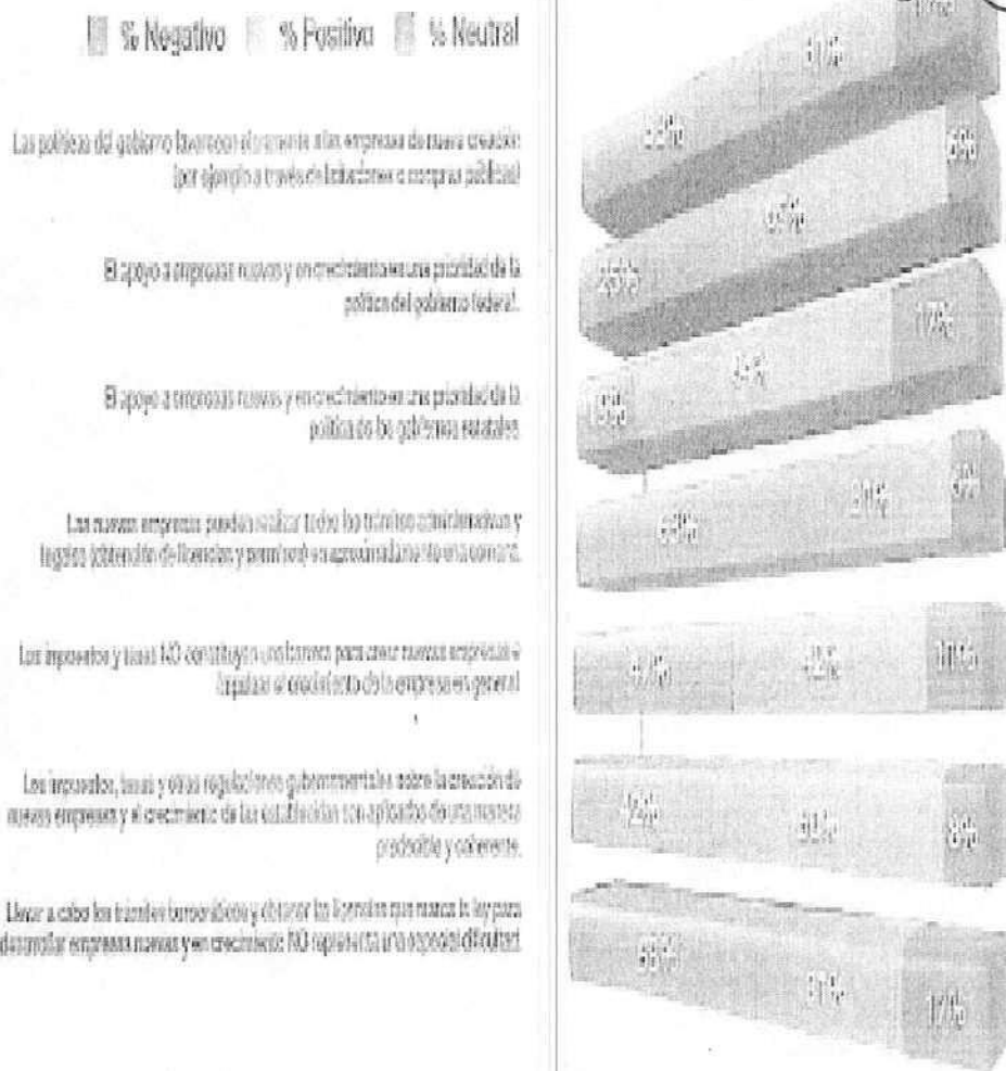
Gráfica A4) Resultados de las encuestas de la dimensión "Políticas gubernamentales".